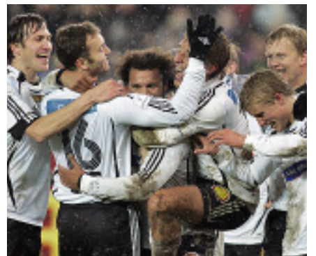
Spillerne jubler etter at Rosenborg ble seriemestre med 4-1 seier over Viking på Lerkendal søndag.

Rosenborg tok sitt 20. seriemesterskap da Viking ble slått 4-1 hjemme i neste siste serierunde. Dermed ble det gullfest på et fullsatt Lerkendal. Nesten 22 000 hadde tatt veien til trønderlagets storstue for å overvære det som kunne bli gullfest, og de fikk valuta for pengene. Brann sikret sølvmedaljene med seier 2-1 over Ham-Kam, mens Vålerenga og Lillestrøm kniver om bronseplassen. I bunnstriden er det klart at Molde må ta veien ned til Adeccoligaen, mens fem lag kjemper om å unngå nedrykk eller kvalifisering før siste serierunde.