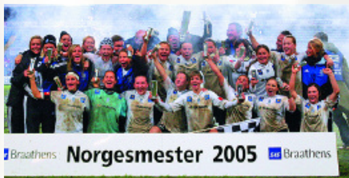
Asker Fotball Kvinner vant finalen i fjor. Greier de å ta sin andre seier på rad og ta revansje på Røa for fintaletapet i 2004?