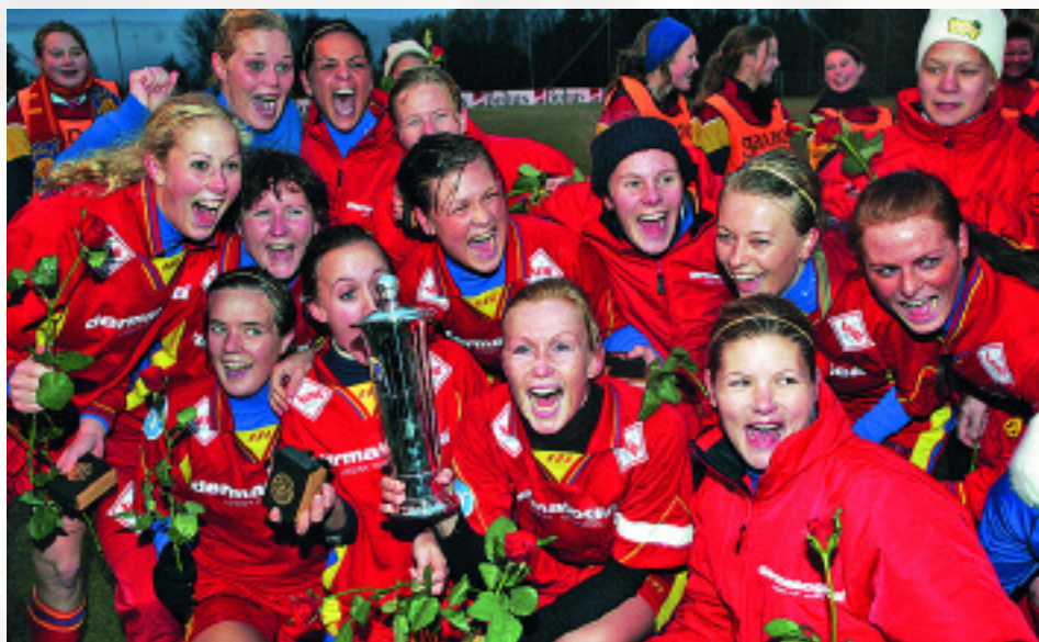
Røa var også med på cupfinalefesten i 2004. Det forventes publikumsrekord på Bislett når laget møter Asker Fotball Kvinner i finalen 11. november.